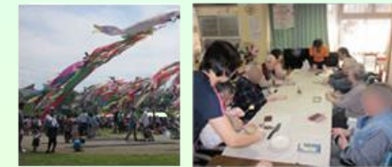
小規模多機能型居宅介護

横浜市泉区和泉町7315-7 電話 045-306-0176 http://izumidai.net/ahyasuragi/