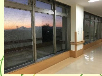
渡り廊下から見える富士山

当院は、左ページのようなお困りごとを気軽に相談していただける、地域に密着した病院です。連携している施設は下記のように多岐にわたります。