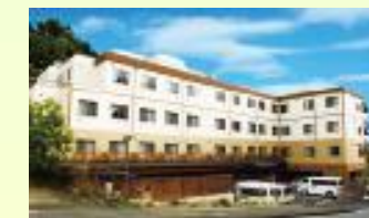
住宅型有料老人ホーム

横浜市泉区岡津町2461-1 電話 045-811-0070 http://izumidai.net/ahokadu/