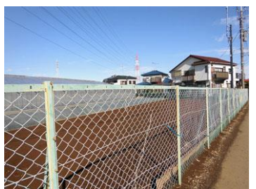
12. 左手には畑・ビニールハウス！