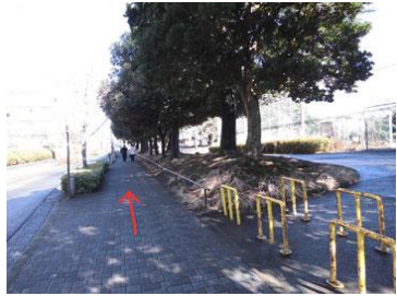
8. 右はグランド 左はグリーンハム（集合住宅）