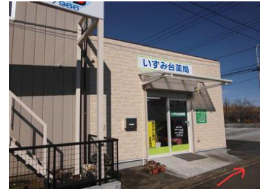
14. 左手にいずみ台薬局