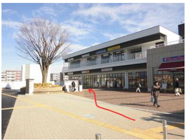
5. 右手にパン屋、スーパーがあります