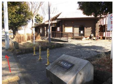
10. 右手にログハウス