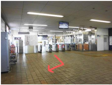
2. 改札を出たら右へ