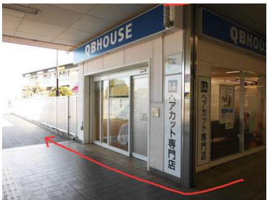
4. 右手にヘアカット店を見ながら進みます