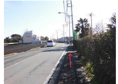
16. 右手に病院の看板