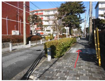
7. グリーンハムという住宅の間を進みます