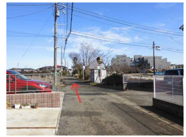
13. 右手に病院の後ろ姿が