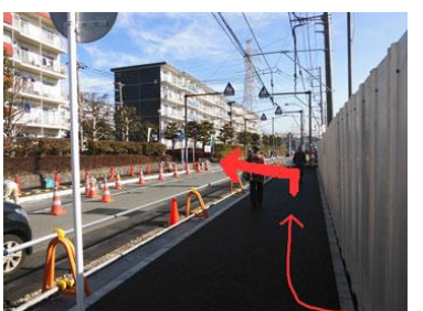
6. 集合住宅の間の道へ