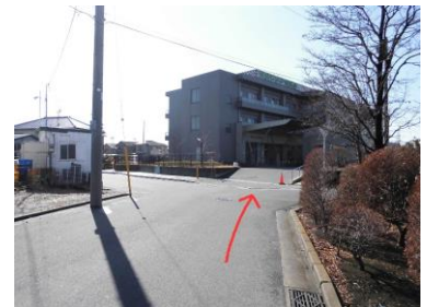
17. 右手に入ると病院正面