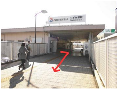
1. 相鉄いずみ野線 いずみ野駅

公園にはお子さんの遊べるログハウスなどもあり、天気の良い日は本当に気持ちのいい環境です！