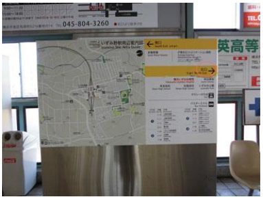
3. 改札正面に案内図があります