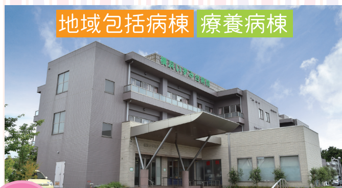
地域包括病棟 療養病棟